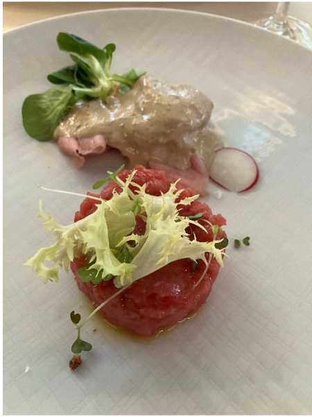
Vorspeise im Ristorante Vecchia Arona