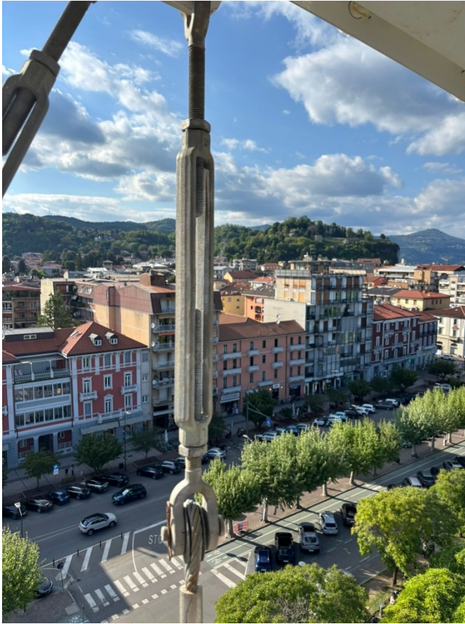
Die Promenade von Arona aus der Riesenrad Perspektive