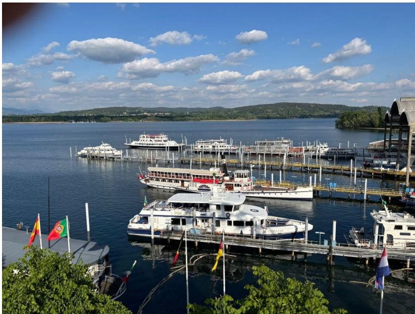
Blick vom Riesenrad über den Lago Maggiore bei Arona