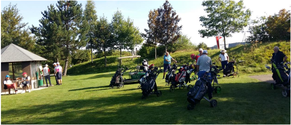
Startvorbereitungen in Les Bois