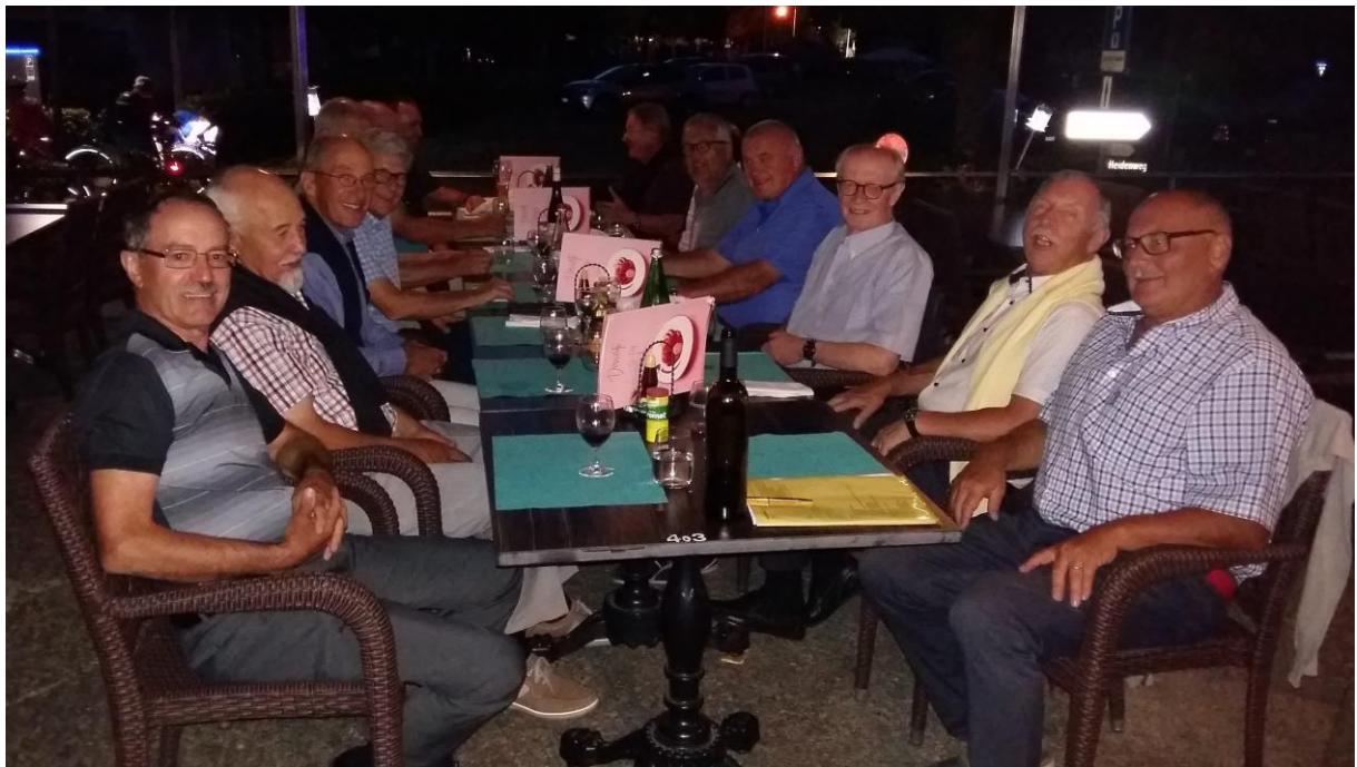
gemeinsames Nachtessen im Rest. Du Port in Erlach

Pünktlich um 18.45 h konnten wir beim Hotel in einen Kleinbus steigen, welcher uns zum Restaurant du Port in Erlach brachte. Unsere 14 Teilnehmer konnten dabei ein sehr gutes und umfangreiches Menu geniessen.