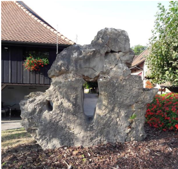
Marmor Stein und Eisen bricht ....