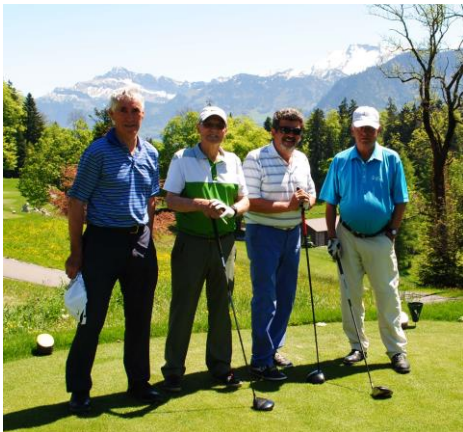
Flight Nr. 8 startbereit vor toller Kulisse

und hier noch weitere Impressionen dieses eindrücklichen und schönen Tages: