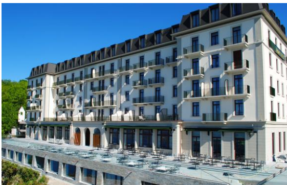
Das alte Palacehotel in neuem Glanz