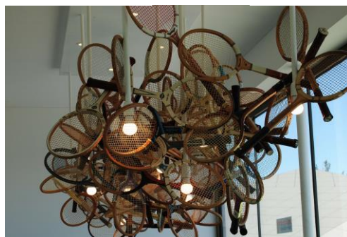
Skulptur von alten Tennisschlägern im Eingang zum Tennis Dome"