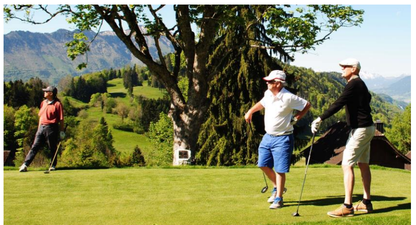
Bange Frage: wohin fliegt er und wo landet er wohl?