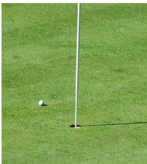
Guter Schuss !!