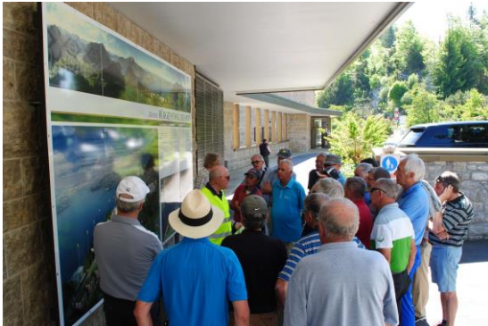
Besammlung und Orientierung

und hier noch einige Impressionen von Ergänzungsprogramm "Bürgenstockresort"