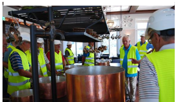
hoffentlich verderben die vielen Köche nicht den Brei