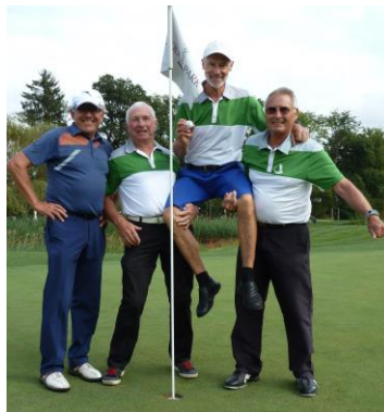
Hoch soll er leben